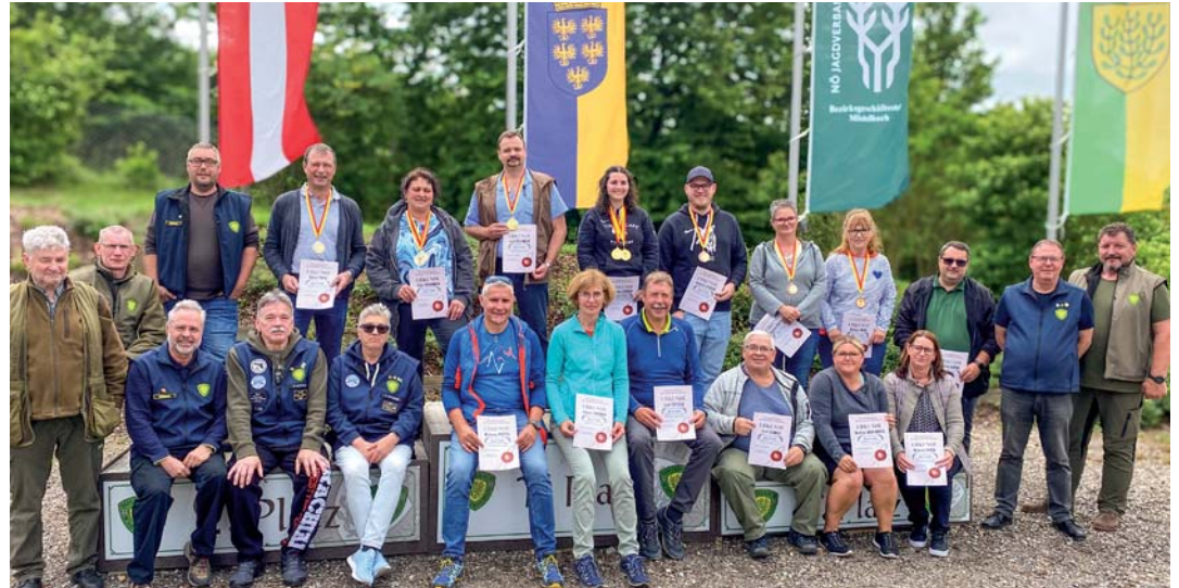
Für alle Teilnehmer war es ein sehr aufregender Vormittag beim Schützenverein Mistelbach. Das riesige Areal des Schützenverein Mistelbach bietet verschiedenste Möglichkeiten, den Schießsport zu erleben.

Die Instrukteure des Schützenverein Mistelbach erklärten sehr genau den sicheren