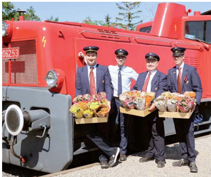
Bei der Rückfahrt wurden die Mütter mit einem Blumengruß verabschiedet.

Eine Woche später fand der Muttertagszug statt, bei welchem nach einem Sekt-Empfang vom Mistelbacher Lokalbahnstation nach Prinzen-dorf-Rannersdorf gefahren wurde, wo seitens des Vereins Neue Landesbahn die Möglichkeit organisiert wurde, das einzigartige Barockjuwel Schloss Prinzen-dorf zu besichtigen.