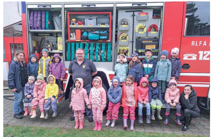
Während des Besuchs bei der Freiwilligen Feuerwehr Wilfersdorf wurden die Kinder mit Würstl, Brot und Getränken versorgt.

Nachdem jedes der Kinder im Mannschaftsbereich des Rüstlöschfahrzeuges Platz genommen hatte, konnte mit den Strahlrohren des RLF Wasser verspritzt werden.