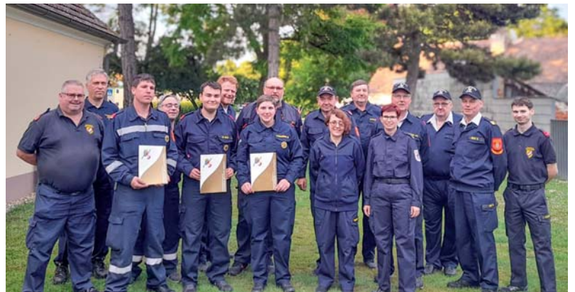
Im FF-Haus Wilfersdorf wurden die beiden herzlich von den Kameraden empfangen und es wurde zum Erhalt des Abzeichens gratuliert.

Das Kommando der FF Wilfersdorf gratuliert zum Goldenen Leistungsabzeichen und bedankt sich beim Betreuersteam des Bezirks für die Unterstützung und Schulung der Kameraden.