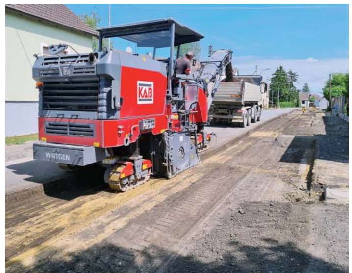
Von der Straßenmeisterei Mistelbach wurde für die Herstellung der Nebenanlagen auf der Länge von ca. 1.530 m eine überarbeitete Kostenschätzung für die geplanten drei Bauabschnitte übermittelt.