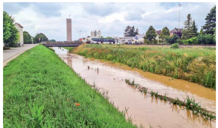
Wie wichtig die Entfernung von Bewuchs in den Gerinnen ist, zeigte das Starkregenereignis Anfang Juni. Aufgrund der vorbildhaften Pflege konnte das Wasser im Zayaoberlauf - westlich von Mistelbach - gezielt abfließen.